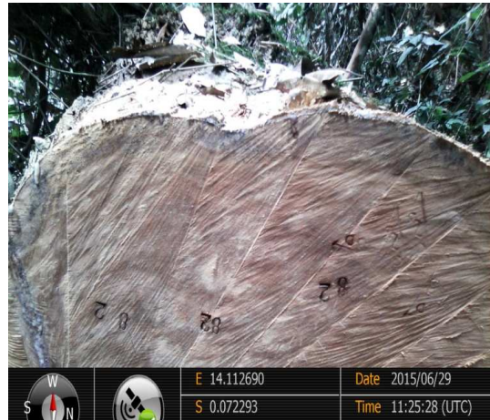
Figure 1: Moabi fût n° 82 avec "COD Z3"

Les codes et les coordonnées géographiques indiquent clairement que ces coupes ont été effectuées dans l'ACA 2015, alors qu'au 29 juin 2015, la société n'était pas encore autorisée à exploiter dans l'ACA 2015.