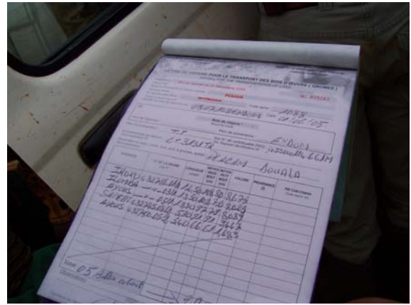
Photo 4: LV portant des billes dont les No correspondent au feuillet DF10 vierge