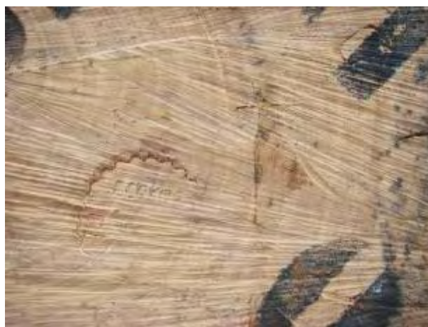
Photo 6 : Marque du marteau forestier