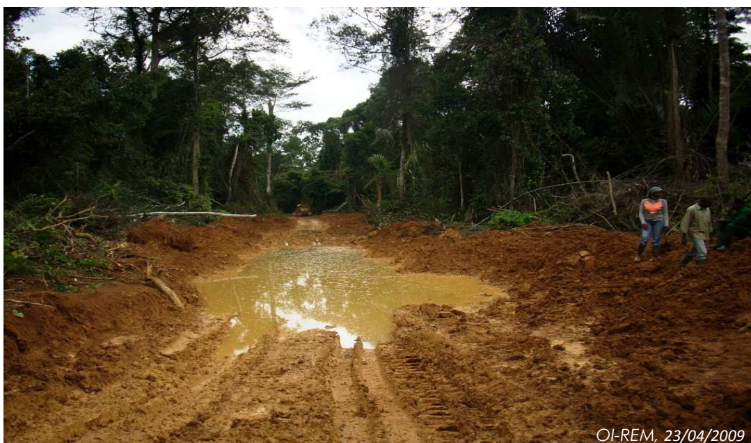
Photo 2 : route inaccessible (principale desserte de l'AAC 2-5) dans l'UFA 09023.

La mission n'a pas eu accès à la zone en cours d'exploitation du fait de l'état impraticable des routes dû à leur mauvaise construction associée aux fortes pluies dans la région (voir photo 2).